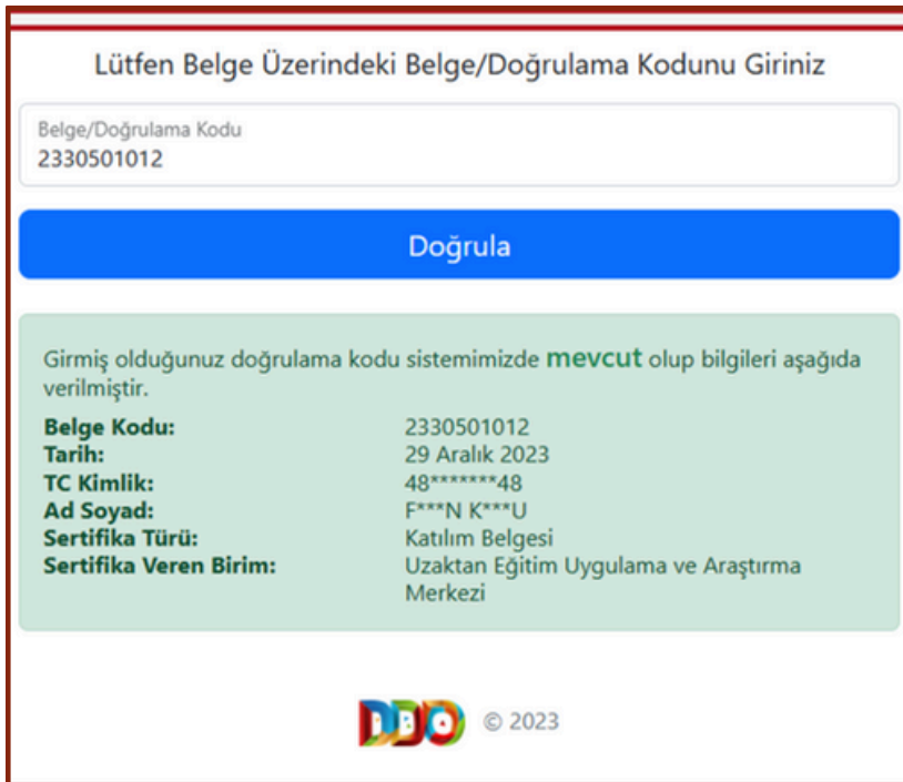
Şekil 2. Örnek olarak doğrulama kodu sorgulanan bir belge sonucu