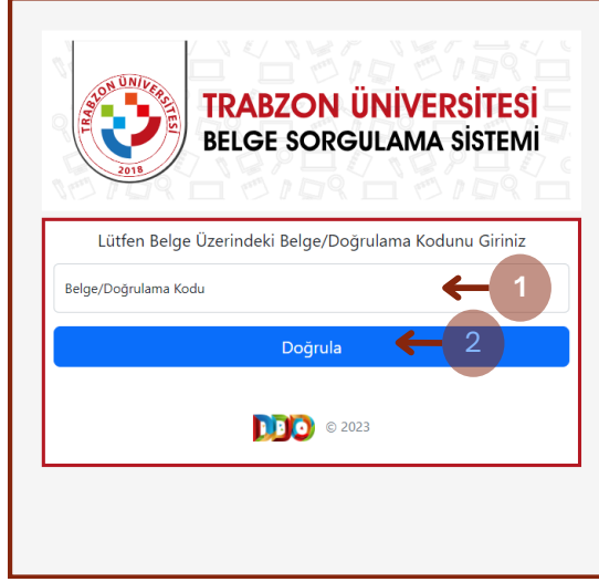
Şekil 1. Giriş ekranı